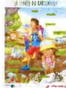
Missions pédagogiques à destination de tous (charte du randonneur, patous, incendies, chasseurs, environnement et biodiversité, culture, etc.)