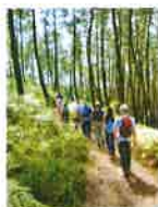
L'accompagnement des clubs affiliés