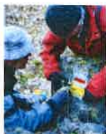
Création Entretien et Balisage des sentiers