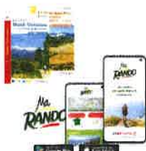
Promotion et Valorisation de la randonnée